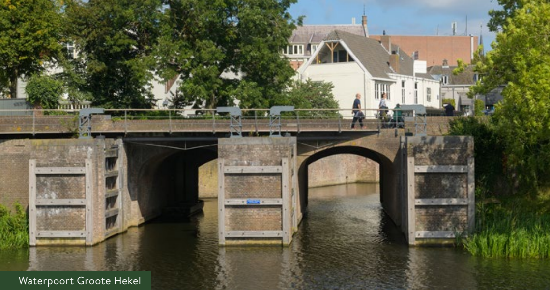
Waterpoort Groote Hekel