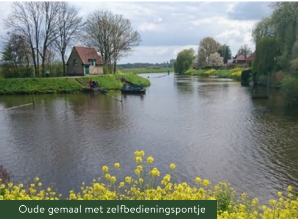
Oude gemaal met zelfbedieningspontje

Bij het zelfbedieningspontje staat het oude gemaal van het waterschap uit de jaren dertig. In de kade van het Bossche Broek zie je witte betonnen blokken. Dit is de bovenkant van het inlaatwerk. Hiermee zetten we het Bossche Broek bij hoogwater onder water. De rest van het inlaatwerk zit onder het zand in de kade. In noodsituaties legt een kraan dit inlaatwerk bloot. Op de plek van dit inlaatwerk brak de kade in 1995 door. Achter de kade ligt een plas die is ontstaan door die dijkdoorbraak.